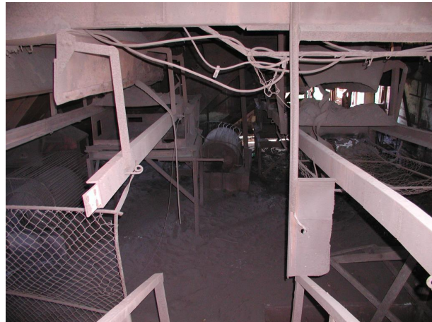
zbytky technologie zásobníku