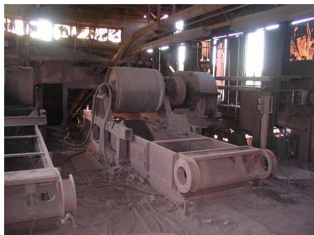
zbytky technologie zásobníku

objekt č.15 - zásobník hotového aglomerátu