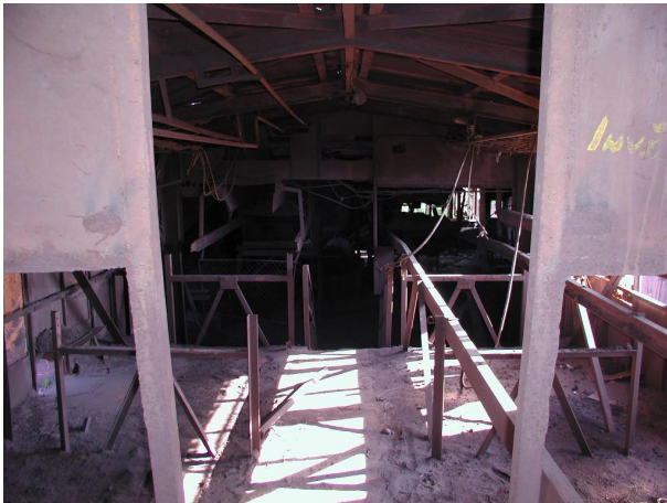
zbytky pásových konstrukcí zásobníku hotového aglomerátu