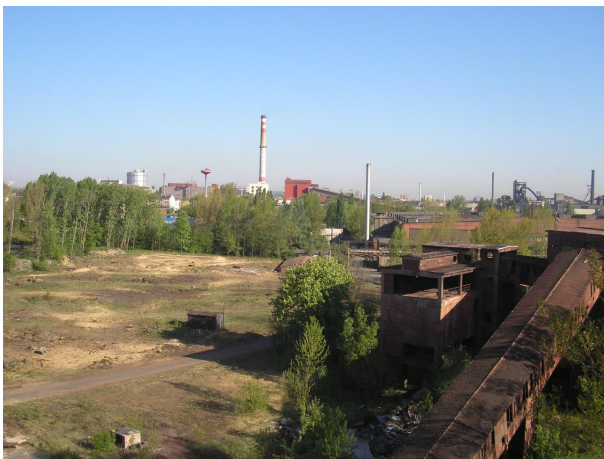
pohled na zásobník hotového aglomerátu a PS A s mostem B6