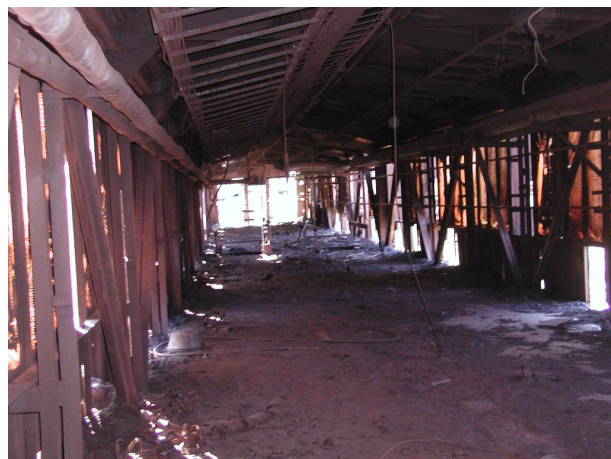
pohled ze zásobníku do mostu B6