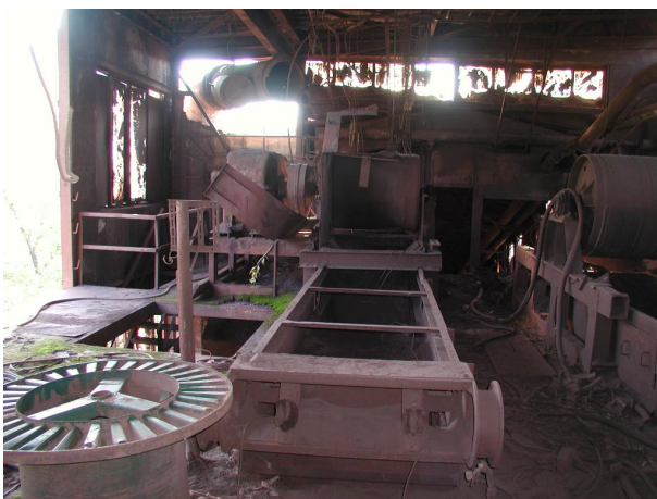
zbytky technologie zásobníku